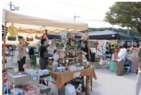
↑南の駅やえせでの様子