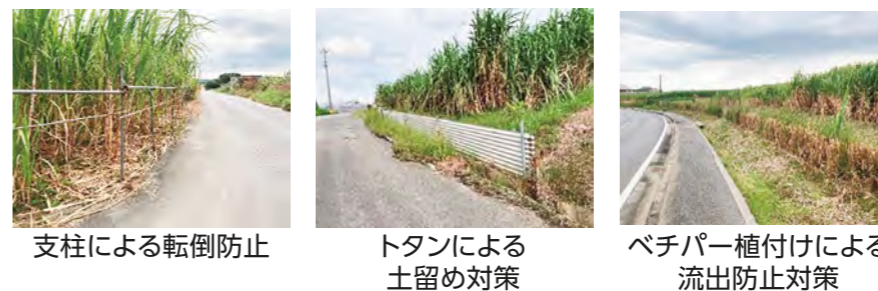
支柱による転倒防止