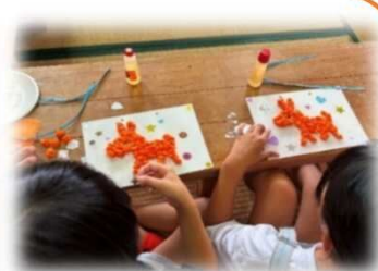
～昨年の様子～ 夏休みの学びの場として開催！ 作品作りも行いました♪