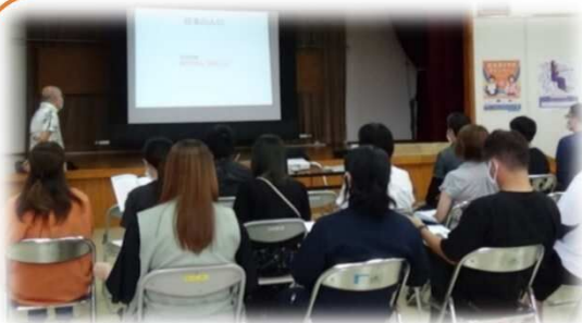
認知症についての基礎知識や地域でできる見守りや支援について学びます

『認知症サポーター養成講座』で認知症について学び、正しい知識で認知症の人を見守り支える人と言います♪