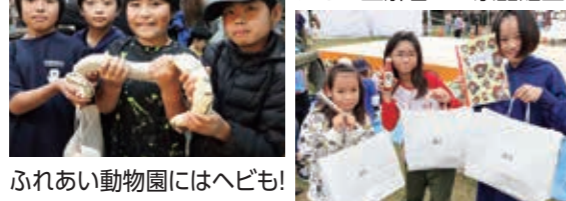
ふれあい動物園にはへびも!