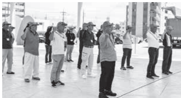
令和7年度 出発式の様子