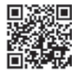
八重瀬町ホームページ