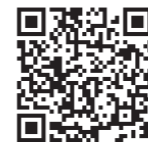
国のホームページ

④お電話による対象かどうかの確認については本人確認が難しいため、回答を差し控えています。予めご了承ください。