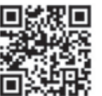
八重瀬町ホームページ

【振り込み詐欺】や【個人情報の搾取】にご注意ください!! 自宅や職場などに八重瀬町や国の職員などをかたる不審な電話や郵便またはメールがあった場合はお住いの市区町村や最寄りの警察署か警察相談専用電話(#9110)にご連絡ください。