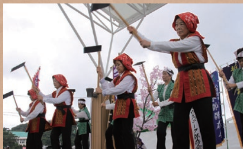
具志頭汗水節保存会による集団舞踊