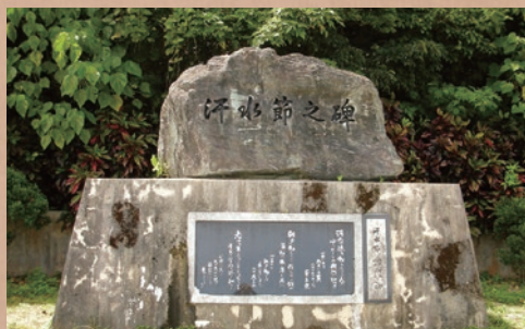
汗水節之碑（仲本氏の生誕80周年記念で建てられた）