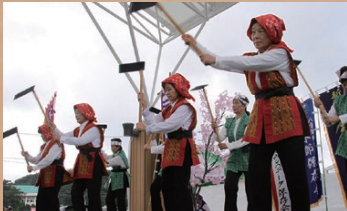
具志頭汗水節保存会による集団舞踊