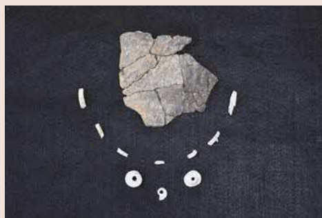
↑ 約6,000年前の土器片(上)と 貝製アクセサリ(下)