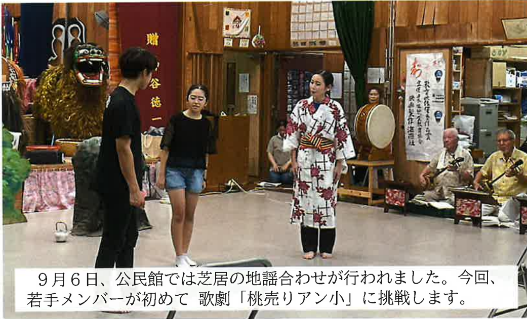
9月6日、公民館では芝居の地謡合わせが行われました。今回、若手メンバーが初めて 歌劇「桃売りアン小」に挑戦します。