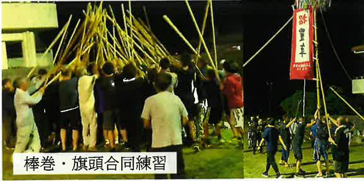
棒巻・旗頭合同練習