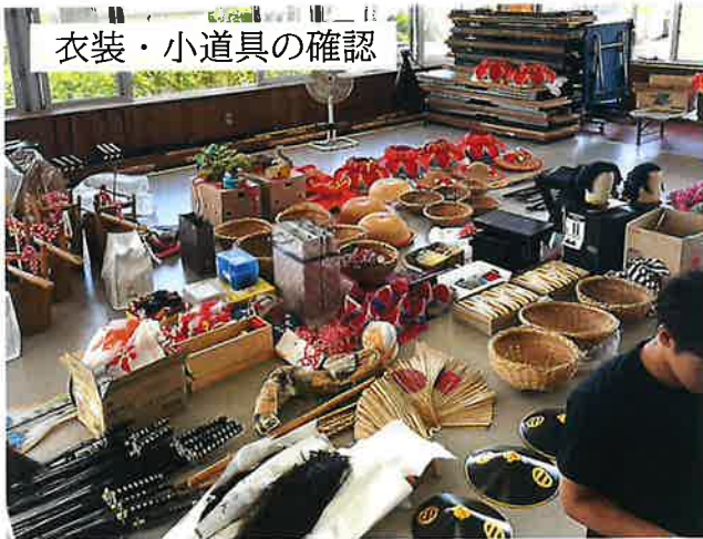
衣装・小道具の確認