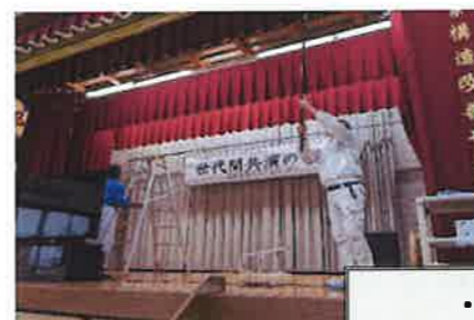
・公民館の普段出来ない所を念入りに

2月25日『区民一斉清掃』ご協力有難うございました。各班の評議員役員を先導に5ヶ所の清掃箇所をキレイにしてもらいました。中には小さなお子さんを連れてご協力してくれた、パパやご夫婦揃っての参加者もいました。最後は老人会よりメーバル川周辺行なった青年達に『私達の出来ない所をしてくれてありがとうね』とのやりとりもありました。清掃を通しての世代間交流も感じられました。これぞ、自治会ですね