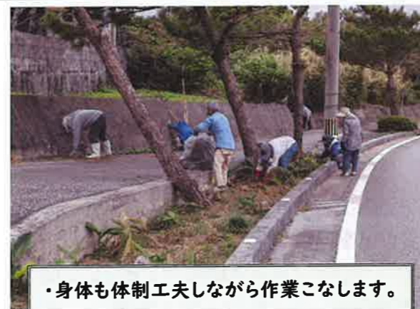
・身体も体制工夫しながら作業こなします。