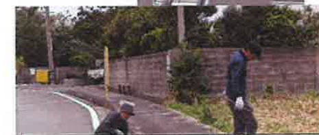
・子ども達の通学路