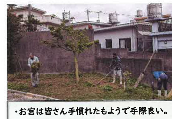
・お宮は皆さん手慣れたもようで手際良い。