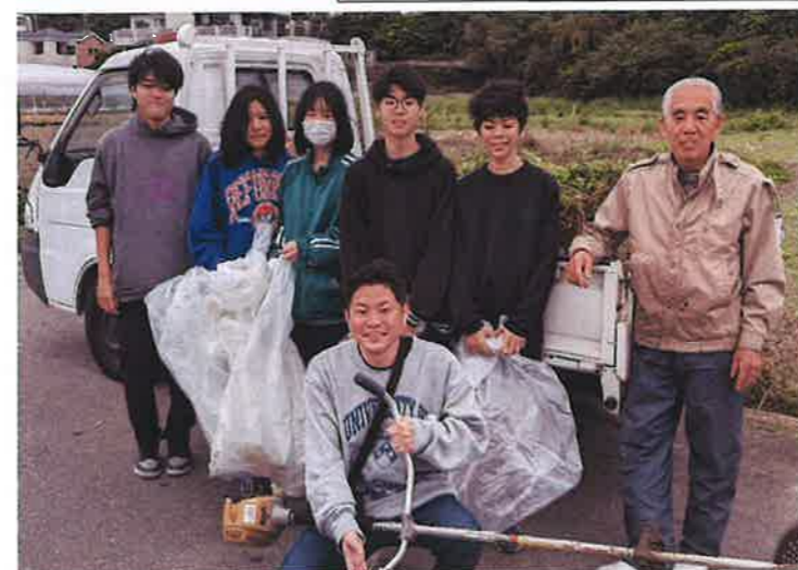
・青年会担当メーバル川周辺はたくさんの助っ人が来てくれました。