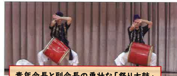
青年会長と副会長の勇壮な「祭り太鼓」