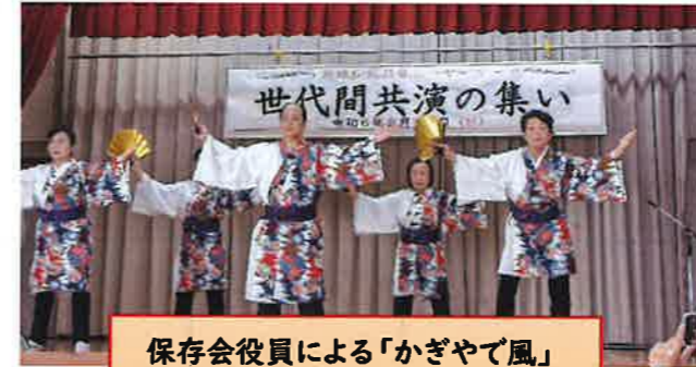
保存会役員による「かぎやで風」

2月18日は、シヤーマー「世代間共演の集い」を公民館にて開催しました。シヤーマー保存会の役員が具志頭中学校の総合学習の時間に継承するため踊りを教えてきたそうです。下は中学1年生から上は80代の方まで皆さん踊りきりました。賑やかさと迫力がありました。演舞者の次世代に繋げて行きたい想いは皆さんに届きましたでしょうか？