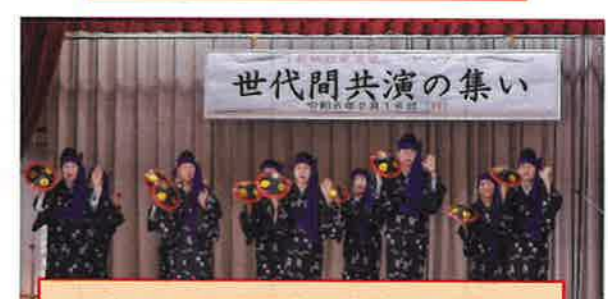
先輩会員と現役会員の優雅な「女踊り」