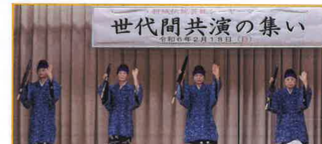
保存会会員による優雅な「前踊り」