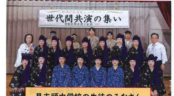
具志頭中学校の生徒のみなさん