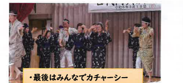
・最後はみんなでカチャーシー