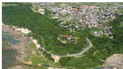
上空から見たホロホローの森