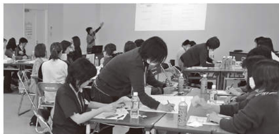
町介護支援専門員研修会