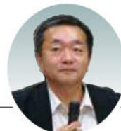
特定非営利活動法人 全国コミュニティライフ サポートセンター (CLC) 理事長