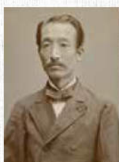
上杉 茂憲公肖像

茂憲の在職は2年弱。短い期間に教育振興に力を注ぎ、貧困にあえぐ農民のために中央政府に沖縄の旧慣改革を訴え続けました。その志は有名な「なせば成る なさねば成らぬ何事も」の名言を残し、数々の藩政改革で米沢藩を立て直した9代目藩主上杉鷹山をお手本にしたといわれています。