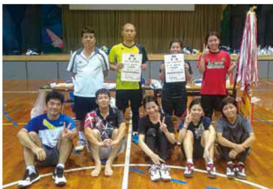
2年ぶりに優勝して喜ぶバドミントン女子チーム

第54回島尻郡体育大会夏季大会で、八重瀬町の各競技が好成績を収めています。バレーボール男女、バスケットボール女子、ハンドボール男子、バドミントン女子、ソフトボール男子、軟式野球、剣道、ボウリングの9種目で優勝を勝ち取り、その他の競技でも善戦しています。八重瀬町は現在のごころ、総合トップに躍り出ています(9月11日現在)。