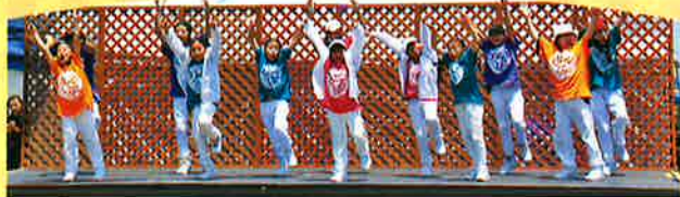
ワッツアップアケメダンススクール