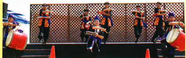
ジュニアリーダーの創作エイサー