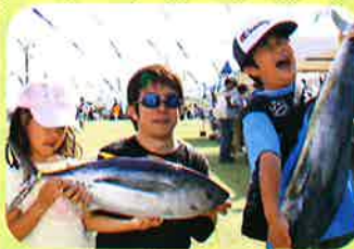
きょうだいでゲット!

抽選会では、マグロやシイラが1匹まるごと当たる「紐くじ」が登場。 お昼から3回行われた抽選会は、当たりが50本! 大物を狙って大いに盛り上がりました。