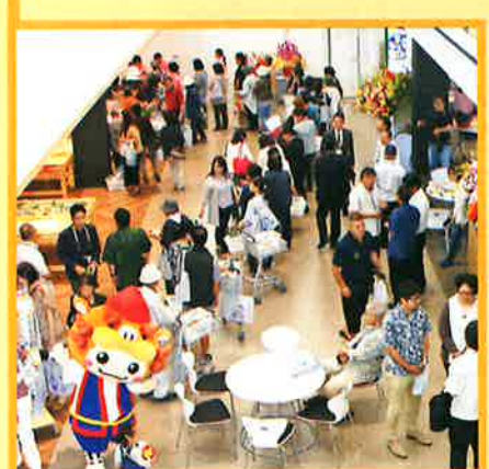
待合・休憩スペース

南の駅やえせ 営業時間 夏期(4月から10月) 10:00~19:00 冬期(11月から3月) 10:00~18:00 〒901-0512 八重瀬町字具志頭659番地 ☎ 098-851-3824 FAX 098-851-3825 2階貸室(会議室・調理室)10:00~22:00 ※貸室は予約が必要です。 料金 500円/1時間・電気料 500円/1時間