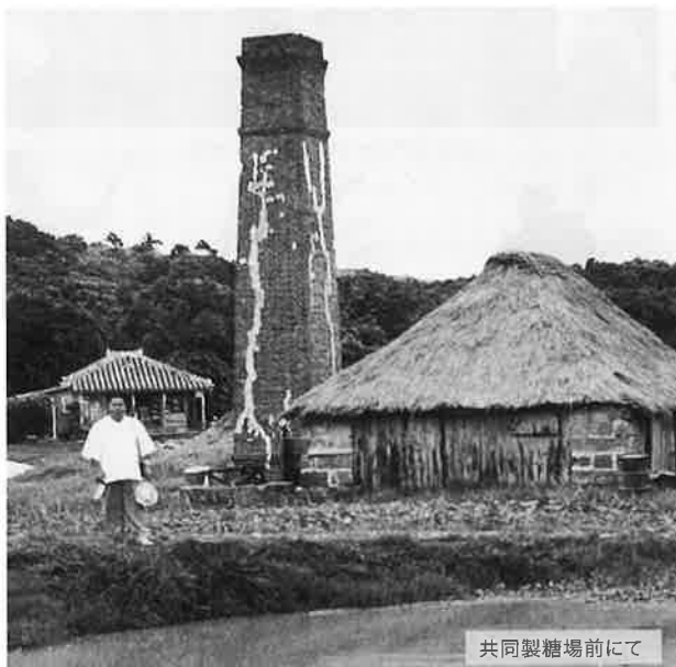
共同製糖場前にて

字具志頭では字誌編集に伴い、収集した写真や資料を活用し具志頭の歴史や文化の事をより深く知り、字の先輩達の活動や功績をみんなで共有し伝えていく一つのステップとして写真・資料展を企画しています。