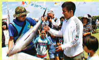
海の幸が当たる「紐くじ」