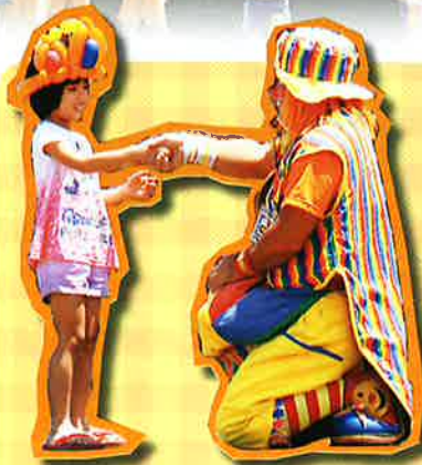
クラウン・コトラショー

港川保育園児のシーちゃんダンスを皮切りに、エイサーや大道芸、平成仮面ライダーショーも行われ、たくさんの方の親子連れで賑わいました。