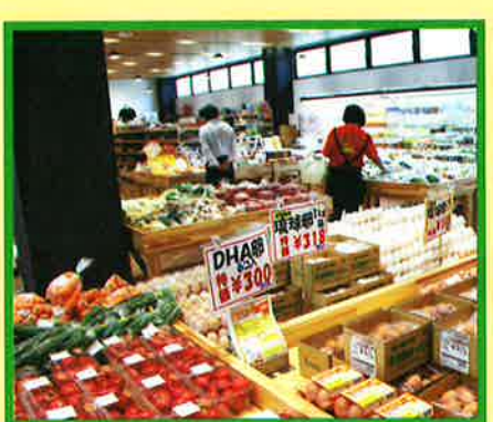
農産物販売 100戸の農家が農産物を納めています

施設1階は、農家が納める野菜や惣菜・お菓子の即売のほか、泡盛や焼き物などの土産品コーナー、八重瀬町役場具志頭出張所も併設しています。2階は修学旅行生の平和学習等に利用可能な多目的室・調理実習室を備えています。外には飲食店舗が並び、トビウオのにぎりずしやヤギ汁など、八重瀬ならではの食を楽しめます。