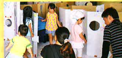
ダンボールアート