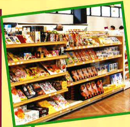
お土産もここでゲット