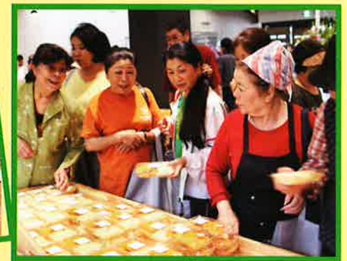
お惣菜もいろいろ