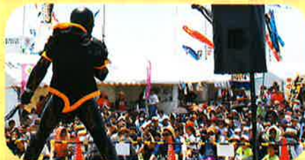
平成仮面ライダーショー