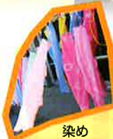
染めこいのぼりづくり