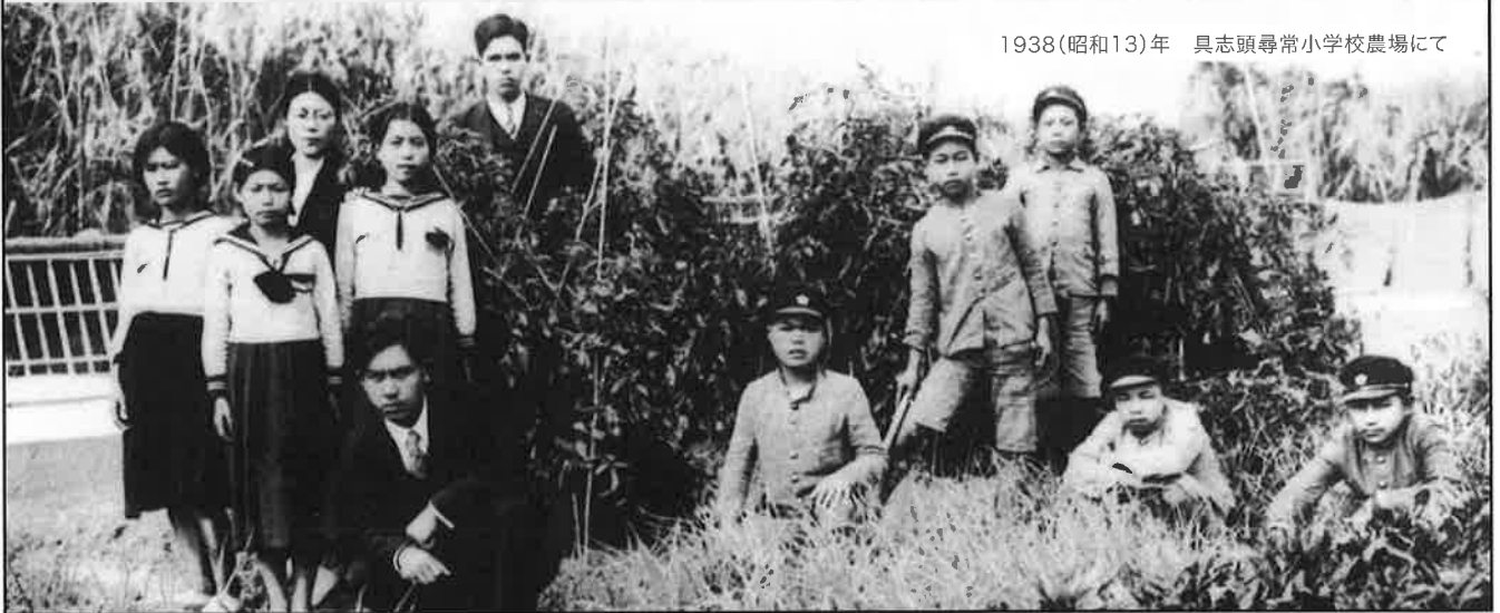
1938(昭和13)年 具志頭尋常小学校農場にて