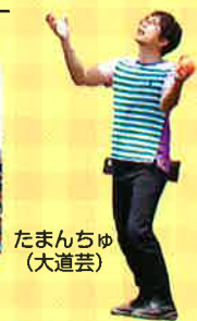
たまんちゅ (大道芸)