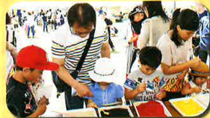
カラフル砂絵体験