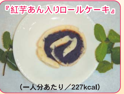
『紅芋あん入りロールケーキ』

材料 (4～5人分) ホットケーキミックス.....200g 水.....180cc <あんこ> 紅芋(事前に蒸して裏ごししたもの)...200g 砂糖.....70g はったい粉.....大さじ2