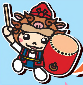
やえせのシーちゃん