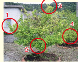
東西南北から4枝採取

※サンプルが大量にあり、持ち込みが困難な場合には八重瀬町へお問い合わせください。