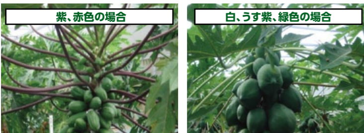
「台農5号」の可能性がります。