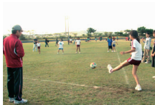
★フットベースボール競技