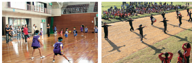
★スーパードッジボール競技