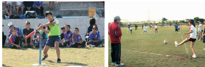
★ティーボール競技

優勝チームはティーボールが「県営外間団地大空子ども会」、フットベースボールが「後原子ども会」、スーパードッジボールが「伊覇子ども会」でした。児童達は、すがすがしい笑顔で優勝を喜びました。