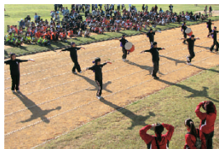
★開会式(ジュニアリーダーの演舞)