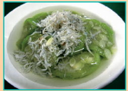
おひたしにもグー☆ 好みの三杯酢をかけてもおいしいですよ。