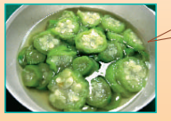
※どー汁＝なべーらーを煮て冷ましたときにでる汁のこと。