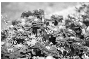
[町花]マリーゴールド

町花・町木・町花木・町魚の制定は、八重瀬町長から諮問を受けた八重瀬町町章・町花木等検討委員会が平成19年3月から9月までに計5回の委員会を行い協議を重ねて来ました。選考に当たっては町民500人と中学生6人を対象にアンケートを実施し、その結果を参考に、委員全員が投票を行い八重瀬町のシンボルが制定されました。