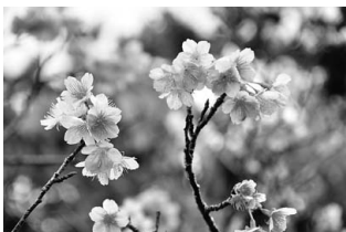
[町花木]ヒカンザクラ