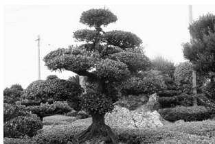
[町木]リュウキュウコクタン