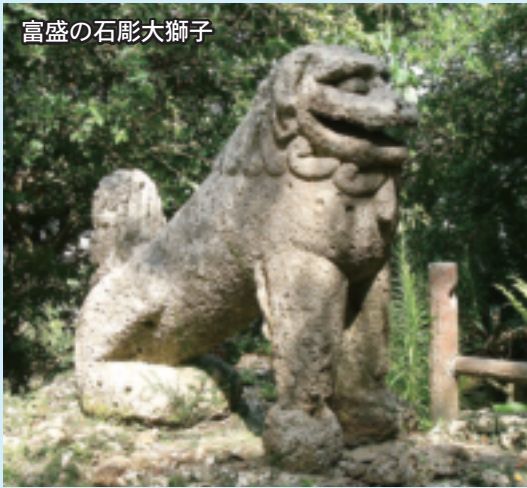
富盛の石彫大獅子