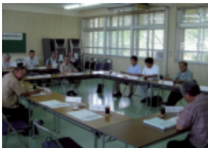
東風平幼稚園移転候補地審議の状況

※八重瀬町公共施設等建設委員会ですべて審議してきました内容につきましては、八重瀬町役場ホームページの行政情報「企画財政課」の「東風平幼稚園整備の検討(移転位置選定作業)について」の中で見る事ができます。