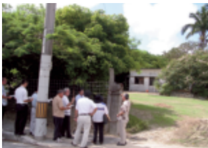
東風平幼稚園移転候補地視察の状況