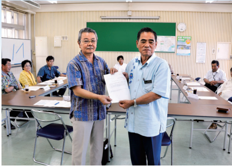
八重瀬町公共施設等建設委員会の答申の状況

の現場視察を行ったほうが良いのではないか。」とのご意見があり、次回委員会で候補地の視察を行うこととなりました。