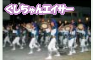
ぐしちゃんエイサー