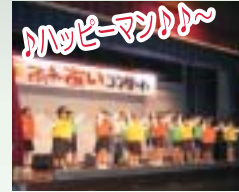
具志頭小学校校歌おどけろ