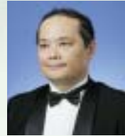
テノール 城間 正