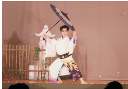
第1回舞踊フェスティバルより