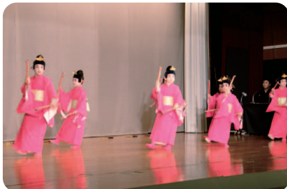
大城好枝琉舞道場による「あやはべる」