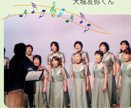
女声合唱団コールリリー