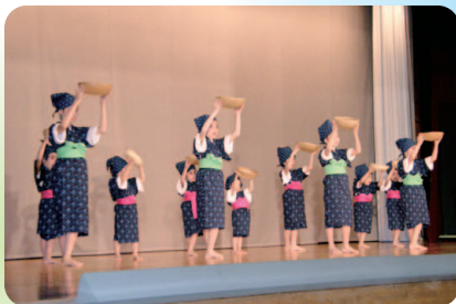
我如古磨佐子琉舞道場による「谷茶前はいニオター」