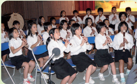
いつまでも平和の世の中だと願いを込めて白川小、具志頭小、東風平中学校の演奏