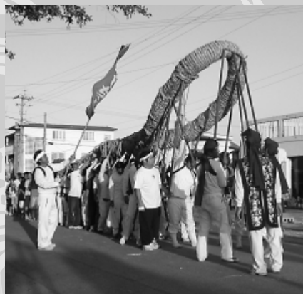
字具志頭の綱引き