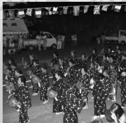
世名城のウステーク