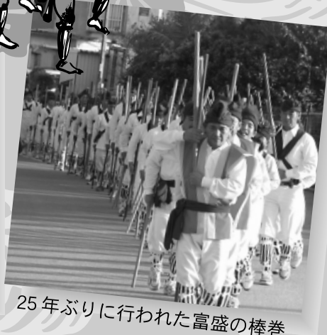
25年ぶりに行われた富盛の棒巻