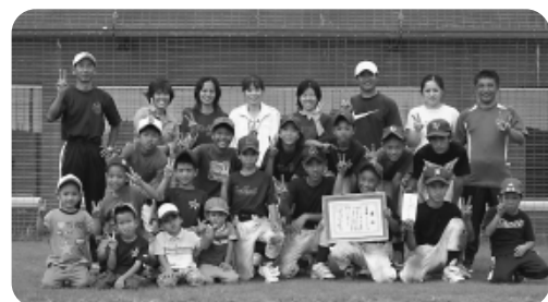
準優勝：はばたけ子ども会

7 月 30 日～10 月 1 日にかけて八重瀬町子ども会主催による第一回「八重瀬町親子野球大会」が開催されました。町内の各単位子ども会から 21 チームが参加し、熱戦が繰り広げられました。大会では、親と子がふれあい、一致協力して白球に向かい共に汗を流しました。決勝戦では「友寄百倉子ども会」が「はばたけ子ども会」を破って優勝しました。優勝・準優勝チームは第 22 回全沖縄親子野球大会へ町代表として派遣されます。