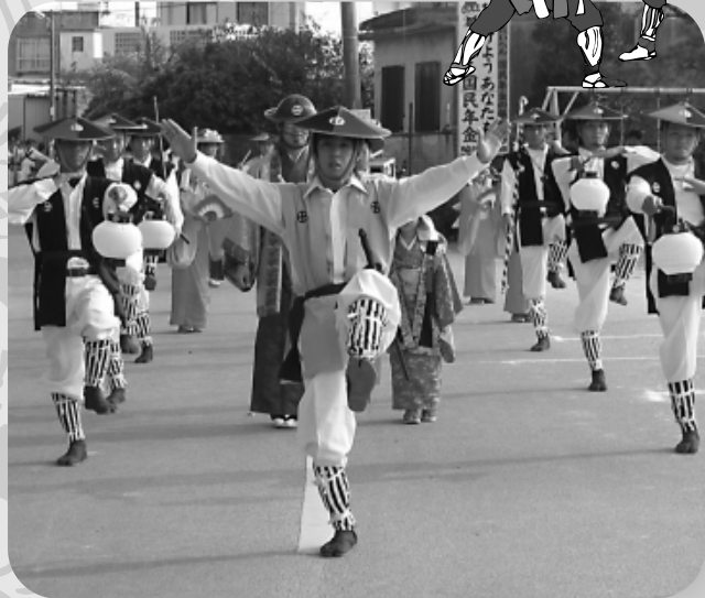
富盛の大和人行列