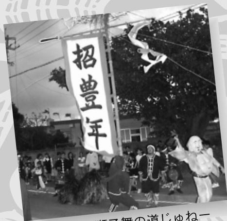
玻名城の獅子舞の道じゅねー