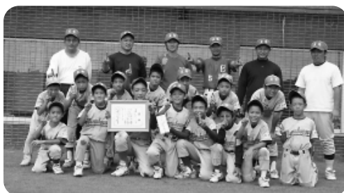
優勝：友寄百倉子ども会