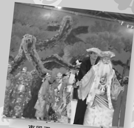
東風平の長者の大王