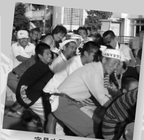
字具志頭の綱引き