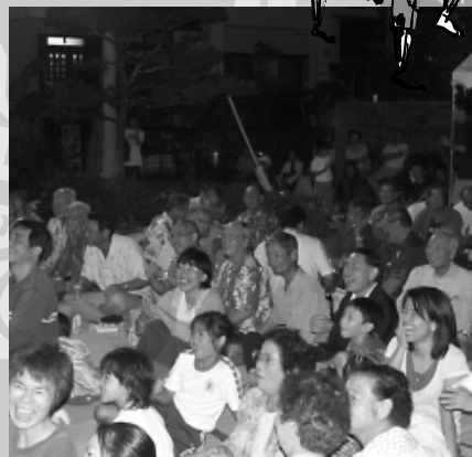
十五夜の余興を楽しむ玻名城区民