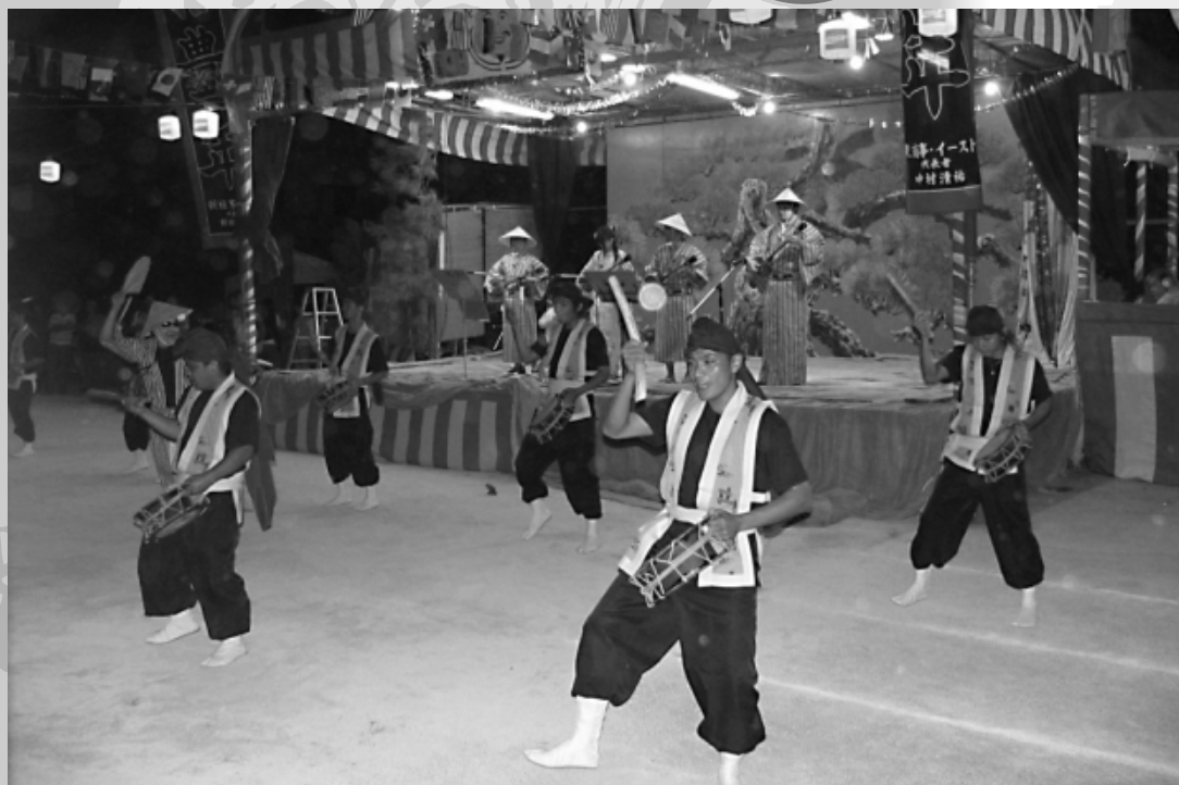
東風平青年会によるエイサー

五穀豊穡を祈願する豊年祭が各字で行われ、迫力のあ る獅子舞や勇壮な棒術、華麗な舞踊、演劇などが披露さ れました。先人たちが残してくれた貴重な伝統文化を引 き継ぐと共に祈願の余興と呼ばれる村芝居に十五夜の夜 は更けていきました。