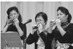
オカリナサークルによる風の丘・いつも何度でも