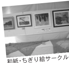
和紙・ちぎり絵サークル