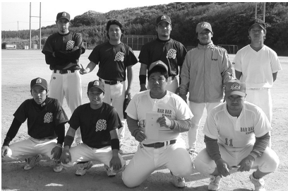
優勝のBAR BAR EMOYAと準優勝のセプテンティーンセブズ

3月5日、東風平運動公園野球場にて第14回東風平町青年野球大会の決勝戦が行われ、獅子舞チームが東風平B・Kチームを5対2で下し優勝しました。また、3月19日、平成17年度具志頭村軟式野球大会の決勝戦が具志頭運動公園多目的広場で行われ接戦の後、BAR BAR EMOYAチームがセプテンティーンセブズを11対9で下し優勝しました。