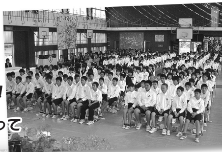
新城小学校 (男:15名 女:16名 計31名)