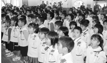
具志頭小学校 (男:46名 女:53名 計99名)