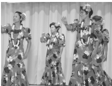
ハワイアンフラサークルによるカイマナヒラ・ケアロハ