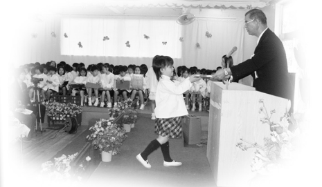
白川幼稚園 (男:38名 女:37名 計75名)