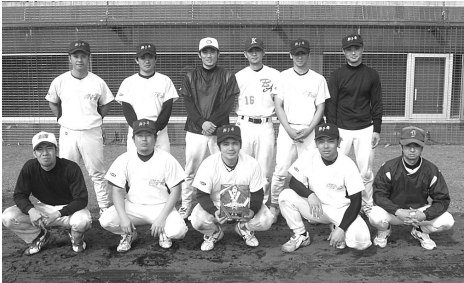
優勝を制した獅子舞チーム