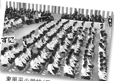
東風平小学校 (男:59名 女:78名 計137名)