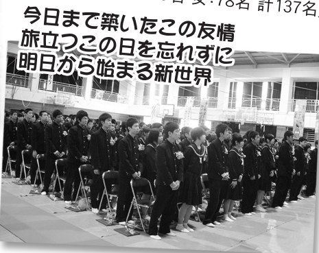
東風平中学校 (男:121名 女:128名 計249名)