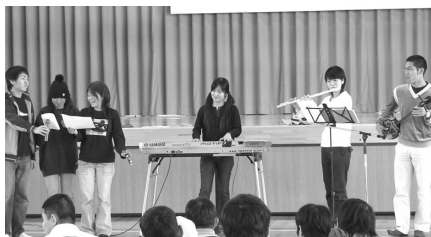
南部地区レクリエーション交流会