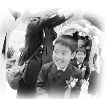
新城幼稚園 (男:11名 女:16名 計27名)