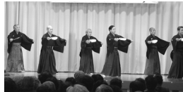
お父さんの琉舞サークルによるかぎやて風