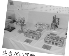
生きがい活動 (ティッシュケース、キーホルダー)