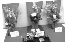
小城婦人会(はご板)