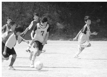
小学生同士のゲーム

フェスティバルには、スポーツを通しての世代間交流があり、子どもたちの健やかな成長を見守ることができるとの大事なつながりが存在していました。