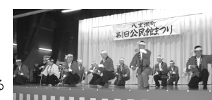
区長・自治会長による汗水節