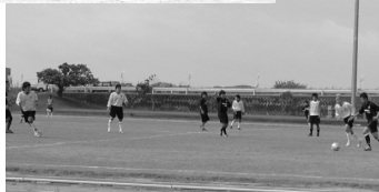
中学3年生と社会人によるゲーム