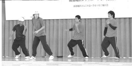
高田地区さんごの会・手をつなぐ親の会