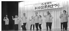
町老連民謡愛好会北部地区(友寄)による花と花