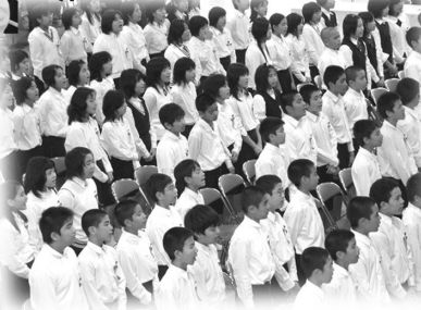
白川小学校 (男:50名 女:65名 計115名)