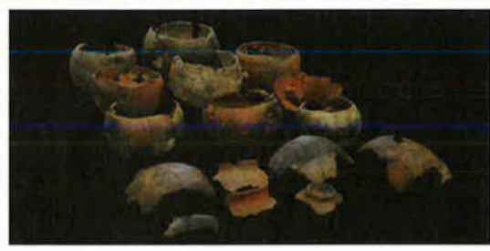
志多伯遺跡より出土したグスク土器(約800年~600年前)

八重瀬町字志多伯で2005(平成17)年から2006(平成18)年にかけて行われた志多伯遺跡の発掘調査の成果を出土した遺物(道具)を中心に紹介します。 グスク時代に使用された遺物を実際に観て先人の文化に触れてみませんか?