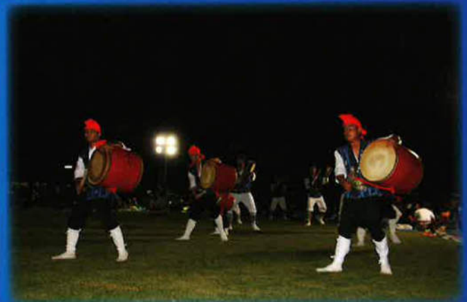
①宇東風平青年会 ②新城青年会 ③富盛青年会 ④安里青年会 ⑤ぐしちゃん青年会