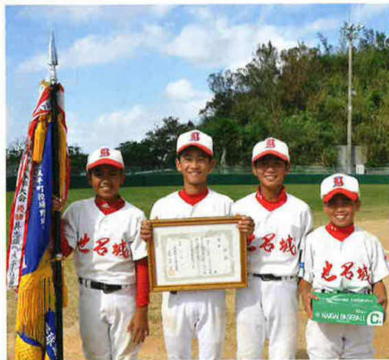
優勝した世名城ジャイアンツ

10月18日、19日の両日、「第27回八重瀬町少年野球秋季大会」が開催されました。町内10チームで熱戦が繰り広げられました。初秋の晴天の中、東風平野と世名城ジャイアンツによる決勝戦となりました。接戦の末、好守の世名城ジャイアンツが1-0で夏季大会に続く連覇を果たしました。