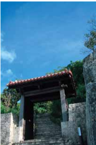
風景 3 西部プラザ公園大門

心癒す森林と青い海、 のどかな田園が残る八重瀬町。 まちの長い歴史と 人々の豊かな文化を繋いできました。 八重瀬町の風景をご覧ください。