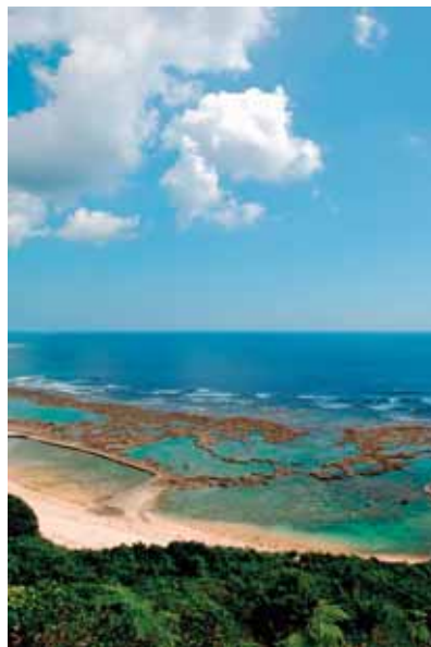
風景 2 玻名城海岸と太平洋