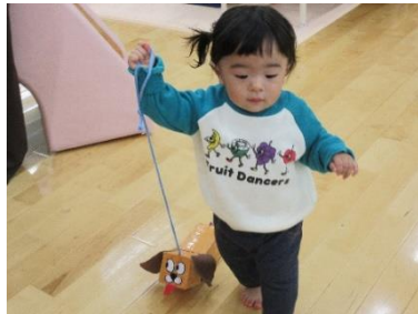
「わんわん」とお話ししながら、お散歩を楽しんでいます。