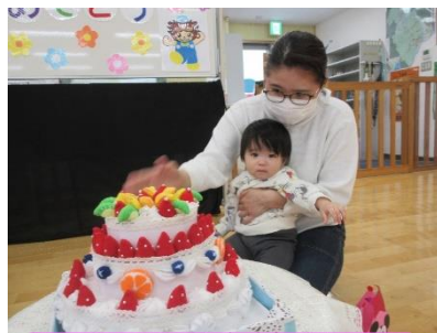
1月生まれの誕生日会 たくさんのお友だちにお祝いされて、楽しい時間となりました。