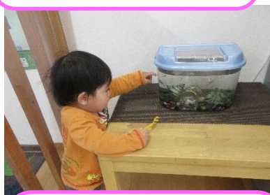
子どもの視線に合わせて、グッピーが見えるようになっています。子どもたちこの場所が好きで、親しみを感じている様です。