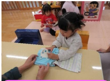
ボタンの布絵本。動物さんの目がボタンになっていて、指先の細かい動きを楽しんでいます。