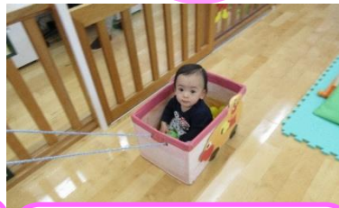
アンパンマンの引き車に乗って、お散歩。引っ張られることでダイナミックな動きを楽しんでいます。