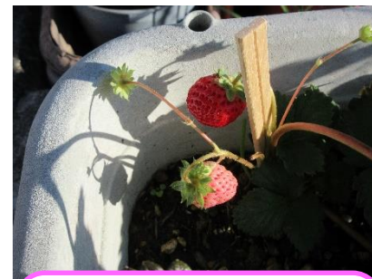
ぴっぴでできたいちごちゃん♡ かわいい姿を見せてくれました。

27日(金)は、お楽しみ会のため、午前中のぴっぴは申込した方のみでの参加となります。午後は13時30分からです。