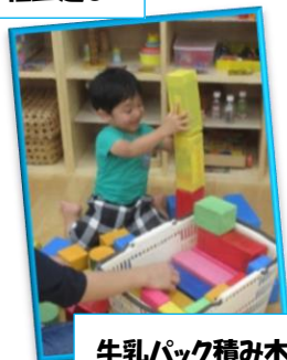
牛乳パック積み木

ぴっぴにフランクが来ました。2歳くらいまでのれます。フランクにゆられて、にこにこ笑顔で楽しそうでした。