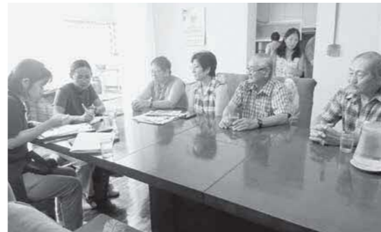
ペルーの調査風景

お問い合わせ | 八重瀬町史編集事務局(八重瀬町中央公民館具志頭分館) | 098-998-9841