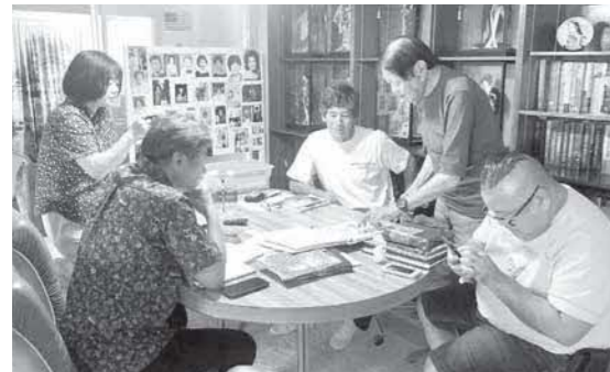
ハワイの調査風景

今年度は南米調査(ブラジル・アルゼンチンなど)を予定しておりますので、移民されたご親戚やご関係者などがいらっしゃいましたら、是非ご協力をよろしくお願いいたします。