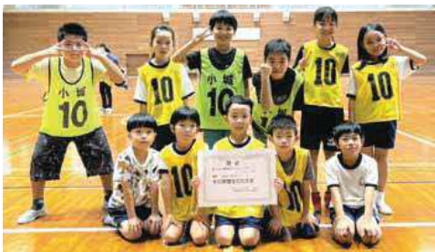
▲スーパードッジボール大会で優勝した小城子ども会