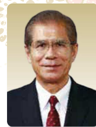
八重瀬町町長 新垣 安弘

令和6年辰年の輝かしい新春を迎えるにあたり謹んでお慶び申し上げます。また、平素より町政運営に對しまして格別なるご理解、ご協力を賜り厚くお礼申し上げます。