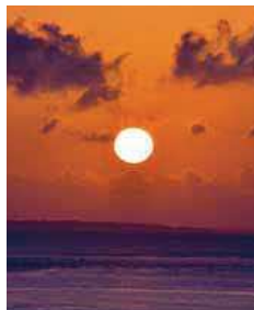
具志頭城址から望む朝日

昨年は沖繩県を襲った大型で非常に強い台風第6号により、県内では二度にわたり暴風警報が発令され、本町を含め県内34市町村に對し災害救助法が適用されるなど町民生活に大きな影響を及ぼし近年でも稀にみる被害を受けました。改めて、防災・減災対策の重要性を再認識したところであり、町民の皆さまの安心・安全な生活を守るための対策強化に、より一層努めてまいりたいと考えます。