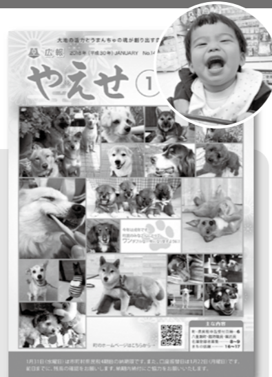
※表紙イメージです (上記は犬の写真を募集した月号)