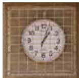
54期生から寄贈された時計

東風平中学校54期生(昭和61・62年生まれ)より12万円の寄付がありました。いただいた寄付で運動場に時計を設置し、兼屋校長は「しばらく運動場に時計が無くて困っていた。ありがたく使っていただきました」と感謝を述べました。