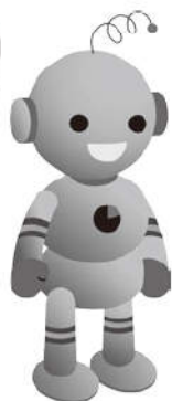
工業統計キャラクターコウちゃん