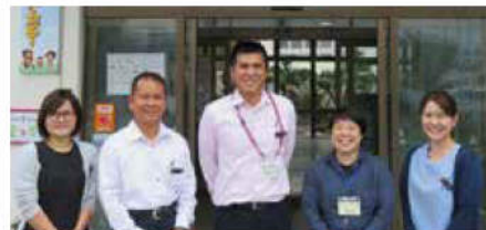
社会福祉協議会CSWです。

高齢者と同居している家族の問題や、要介護状態にはなっていないけれど生活に少し困り感がある等、制度の狭間になっている方々の支援を社会福祉協議会のCSW(コミュニティソーシャルワーカー)につなぎ、困りごとを解消していきます。