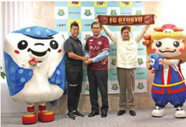
ジンベーニョとやえせのシーちゃんはこのあとサッカー場でPK対決へ

日本プロサッカーリーグ J2 リーグに所属している「FC 琉球」が練習拠点である八重瀬町でのホームタウン活動を展開しています。マスコットキャラクターの「ジンベーニョ」が小中学校でのあいさつ運動を行ったり、保育園や幼稚園を訪れるなどしています。その一環として、4月11日には樋口靖洋監督とジンベーニョが八重瀬町役場を訪れ、町民の日頃の応援に感謝の気持ちを伝えました。