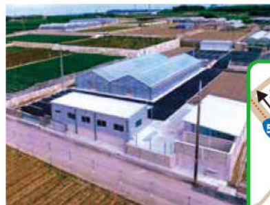
H30年度開設「八重瀬町種苗センター」

申込期 6月7日(金)17時 ※定員に達し次第終了となります。(第2回開催予定あり)