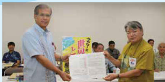
【県産品奨励月間実行委員会】

両会は、地元産品及び地元企業の優先使用により、地区内企業の育成強化と、雇用拡大を促進して地域経済の活性化を促進すると同時に、職員及び町民にも町産品・県産品の優先使用に向けた意識高揚を図るよう要請しました。また、7月2日には町内事業所による展示・販売ブースが町民ホールに設けられ、町産品の普及・消費拡大に向けたPRを行いました。