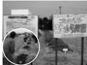
■事務所隣(豊見城市伊良波)