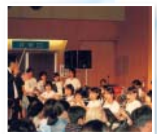
東風平中・具志頭中 吹奏楽部