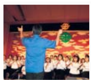
白川小リコーダー同好会