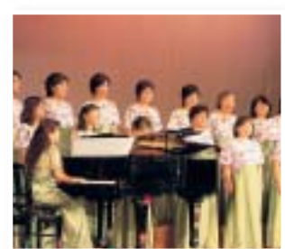
女声合唱団 コールリリー