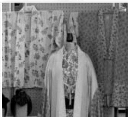
■ハワイから送られた十五夜衣装