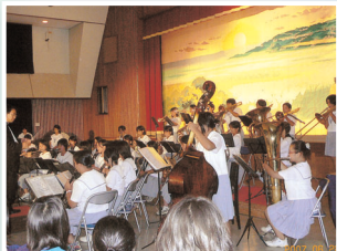
東風平・具志頭中吹奏楽部

音楽は、人々の心を癒し励まします。 あの沖縄戦で受けた悲しみを「平和への希望」に変える架け橋として、 いつまでも平和であることを願い開催する平和事業舞台企画。