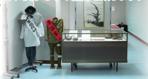
平成十九年度平和資料展