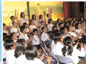
白川小リコーダー同好会 具志頭小音楽部