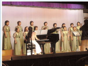
女声合唱団コール・リリー