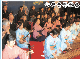
八重瀬町文化協会 古典音楽部会・箏曲部会