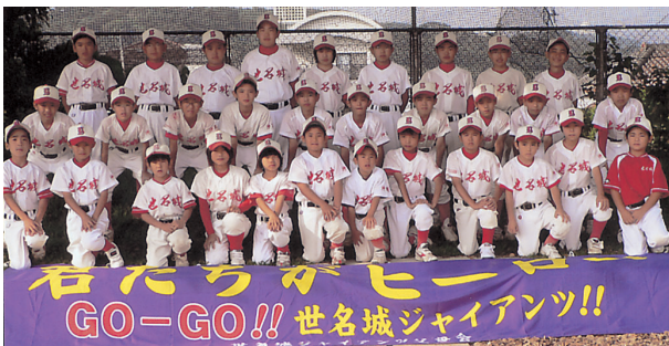
第25回九州少年野球久留米大会に派遣が決定した世名城ジャイアンツ