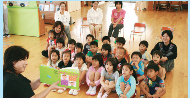
読み聞かせに夢中の新城幼稚園の園児たち

平成13年12月に「子どもの読書活動の推進に関する法律」が制定されたことから4月23日を「子ども読書の日」と定め読書活動の推進に関する活動が全国的に行われています。 町内には、読み聞かせサークルがあり、4月23日、「子ども読書の日」にちなんで新城幼稚園と新城小学校で読み聞かせを行いました。ボランティアの読み聞かせに新城幼稚園の園児たちは、興味津々で夢中で聞き入ってる様子でした。