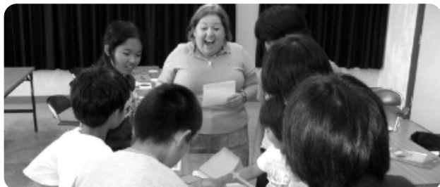
英会話教室（小学生）