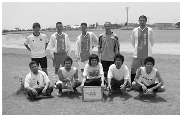
サッカー大会優勝の東風平チーム