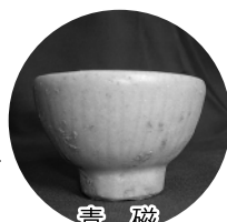
青磁 (グスク時代：中国産)