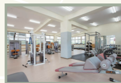
【B】トレーニング施設