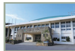
【J】具志頭社会体育館