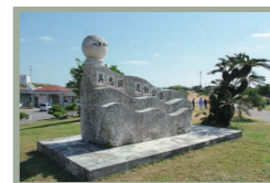
【L】具志頭運動公園 (陸上競技場&パークゴルフ場)