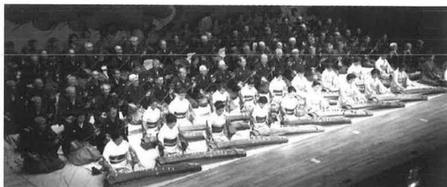
第2回 南部芸能まつり 琉球古典音楽斉唱