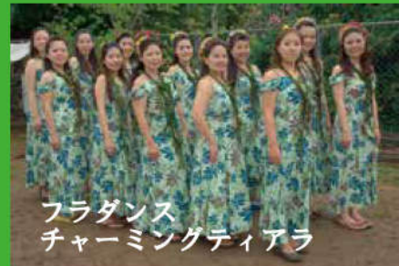
フラダンス チャームングティアラ

フラダンスを通してハワイの言葉や文化、歴史を学んでいます。八重瀬の冬にハワイのあたたかい風を届けました。