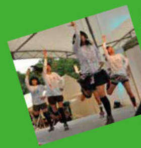
東風平小の児童で結成されたアイドルグループ「ゆめ色クロバーZ」