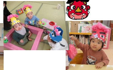
親子で鬼のお面づくり

☆子育てについて心配事などがあれば気軽にお声かけください。心理士がぴっぴに来所し、お話を伺います。